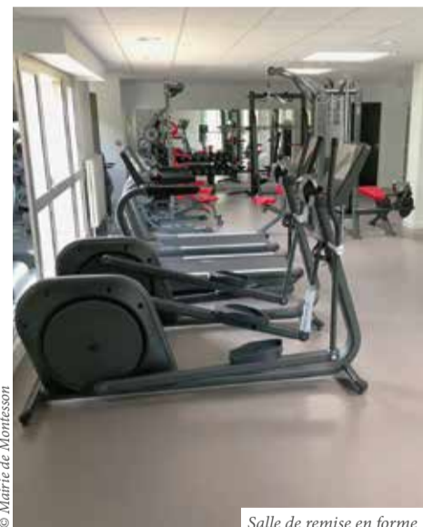
Salle de remise en forme

Ce magnifique complexe comprend la construction du dojo en lui-même de 710 m 2 de surface et la rénovation de la salle Mendes France de 344 m 2 .