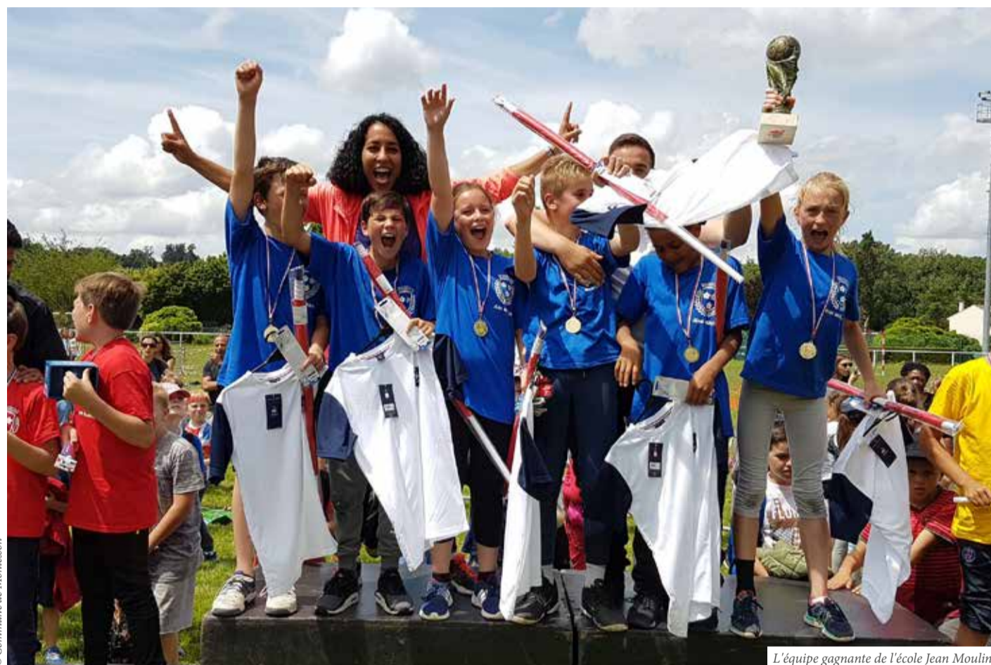
L'équipe gagnante de l'école Jean Moulin