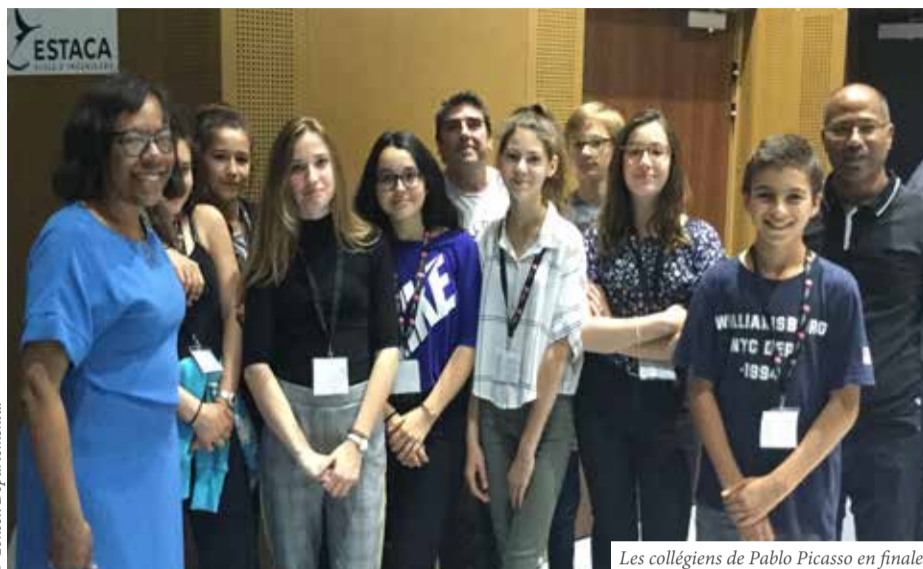
Les collégiens de Pablo Picasso en finale

Grâce à cette initiative du Conseil Départemental, les collégiens, accompagnés des équipes pédagogiques de chaque collège et les élèves-ingénieurs de l'ESTACA, de l'IUT de Mantes en Yvelines et de l'ISTY de l'UVSQ, ont découvert le domaine de la robotique qui illustre l'apport du numérique dans l'éducation. ■