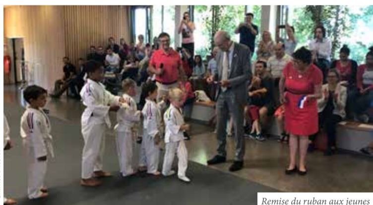
Remise du ruban aux jeunes